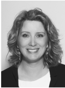
Otilie Laan Blumstone Advocaten